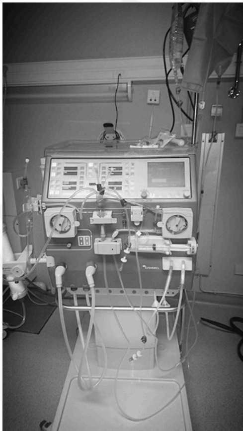
Photographie d'un Dialyseur